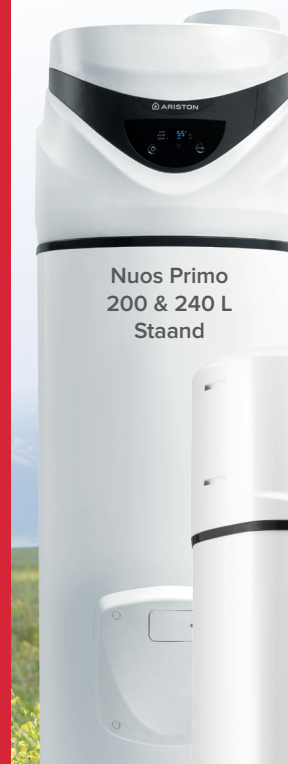
Nuos Primo 200 & 240 L Staand