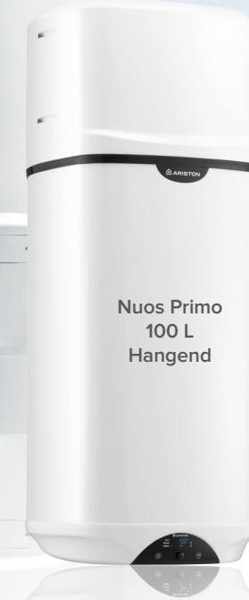
Nuos Primo 100 L Hangend